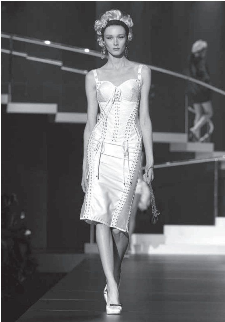
Desfile Dolce & Gabbana para Madonna técnicas de upcycling. Em resumo, a Semana de Moda de Milão de 2024 mostrou uma indústria em transformação, onde a criatividade e a comercialização andam de mãos dadas.

O evento também destacou a importância da sustentabilidade, com várias marcas investindo em materiais reciclados e processos de produção eco-friendly. Fendi, por exemplo, apresentou uma coleção com tecidos orgânicos e