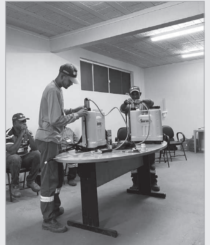
O curso de Defensivos Agrícolas será promovido no município de Aimorés, no Vale do Rio Doce

O treinamento visa garantir o cumprimento da legislação trabalhista, que exige que todos os profissionais que lidam com defensivos agrícolas sejam devidamente capacitados. "Essa formação é de extrema importância, pois garante a segurança dos trabalhadores rurais e promove o uso responsável dos produtos químicos, contribuindo para a preservação ambiental e a saúde dos produtores",