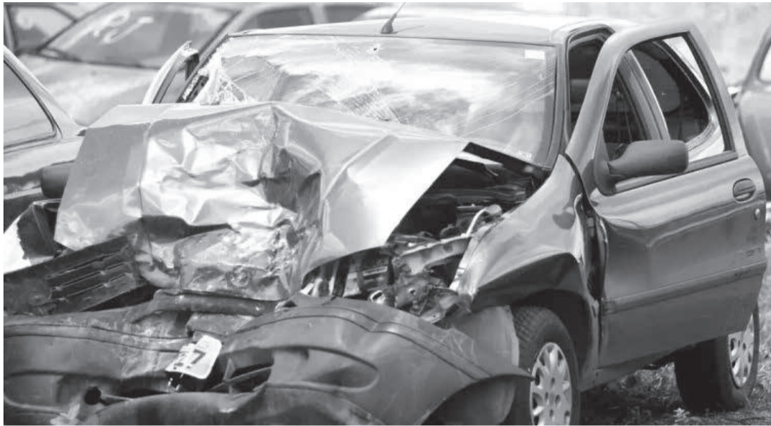
2,5 mil pessoas vítimas de acidentes em Uberlândia

2,5 mil pessoas vítimas de acidentes - Mais de 2,5 mil pessoas foram vítimas de acidentes de trânsito neste ano em Uberlândia. Segundo dados do Observatório de Segurança Pública de Minas Gerais e da Secretaria de Estado de Justiça e Segurança Pública (Sejusp), entre janeiro e julho de 2024, foram contabilizados 8.607 acidentes na cidade, um aumento de quase 4% em relação ao mesmo período de 2023, quando o número de ocorrências chegou a 8.281. Ainda de acordo com o levantamento, do total de vítimas, 1.403 sofreram ferimentos leves, 237 ficaram gravemente feridas e 29 morreram. (Diário de Uberlândia)