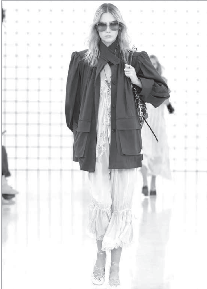
Desfile da Chloé

Mas o movimento fashion de outubro, na capital mineira, vai além da Minastrend. Na mesma semana, acontece o Minas Showroom, que reunirá as melhores marcas de vestuário da cidade. Com o detalhe de cada uma delas vender em