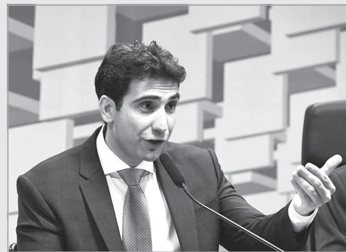
O economista e diretor do BC durante sabatina na Comissão de Assuntos Econômicos na terça-feira, 8 de outubro

Os senadores ainda aprovaram o projeto de lei do Senado (PLS) 170/2018, que determina que as atividades de monitoria do ensino médio deverão ser reguladas por normas dos sistemas de ensino, como a Lei 9.394, de 1996, que estabelece as diretrizes e bases da educação. A pro-