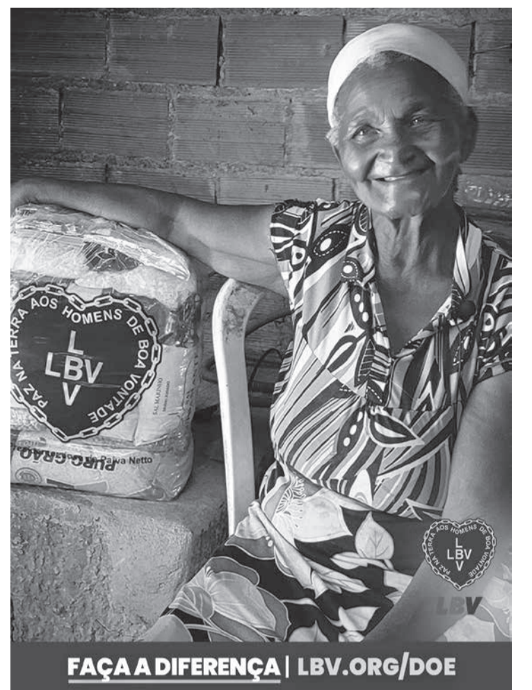
FAÇA A DIFERENÇA | LBV.ORG/DOE

fogo, associação criminosa e corrupção de adolescente. Um adolescente foi apreendido e entregue à responsável legal, após prestar suas declarações. Os presos foram encaminhados ao sistema prisional. A operação contou com o apoio, pela PCMG, da Delegacia Regional de Pedra Azul e delegacias de Medina e Itaobim. E pela PMMG, da 80ª Cia PM de Itaobim, totalizando um efetivo de 25 policiais civis e militares, em 8 viaturas.