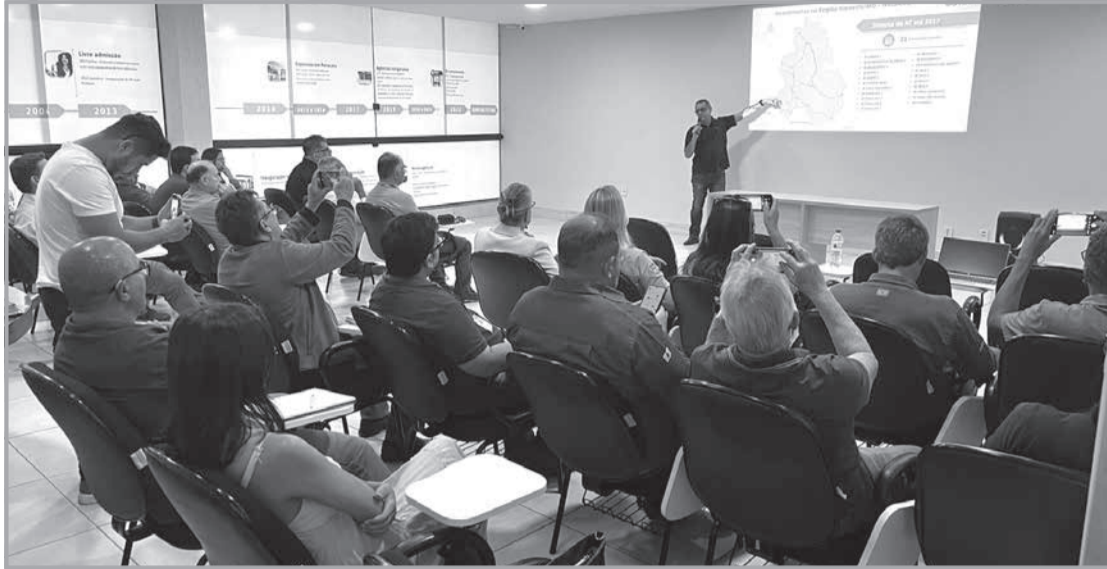
Gestores e agentes de relacionamento da empresa realizaram mais de 270 encontros com entidades rurais e seus associados para apresentação do projeto e acolhimento das demandas em toda a área de concessão da companhia

Empresa implementou canais exclusivos de contato com clientes do campo e realizou mais de 270 encontros com associações rurais para ouvir demandas