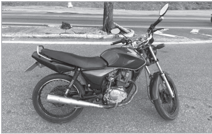
CNH gerando perigo de dano, o condutor foi encaminhado à delegacia de Polícia Civil para os procedimentos pertinentes à polícia judiciária. (Informações/Foto: PRF, Teófilo Otoni).

equipe encontrou divergências nos sinais identificadores do veículo, concluindo que a placa era de outra motocicleta e não correspondia à placa verdadeira do veículo abordado. Além disso, o condutor era inabilitado e por ter gerado perigo de dano, foi enquadrado no crime do art. 309 do Código de Trânsito Brasileiro.