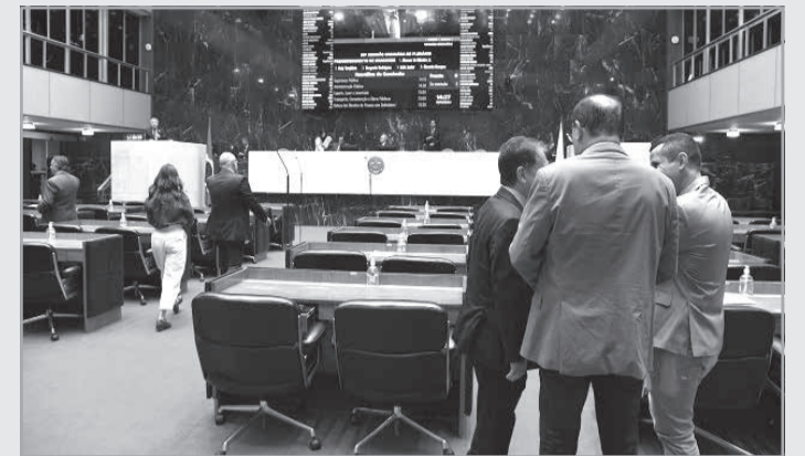
Deputados em Plenário durante a Reunião Ordinária, na Assembleia de Minas, realizada na terça-feira (15)

O governador ainda destaca o aumento de R$ 1,1 bilhão na despesa com o pagamento de juros e amortizações da dívida pública em 2025. Os números utilizados na elaboração da LOA levam em consideração a adesão do Estado ao Regime de Recuperação Fiscal (RRF), que prevê