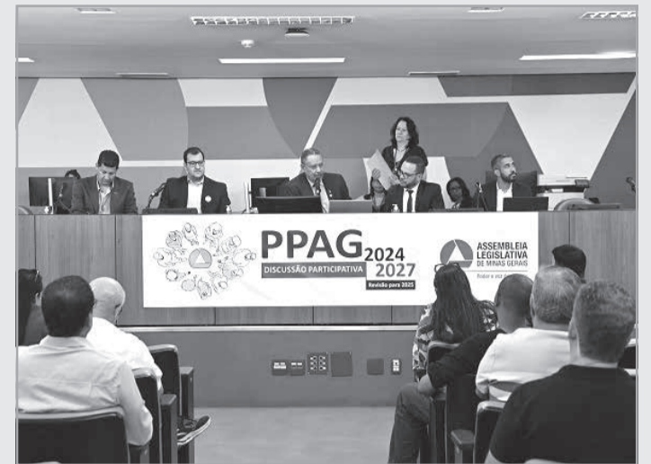
Em audiência conjunta das duas comissões envolvidas no processo representantes do governo apresentaram o planejamento para o próximo ano

Mais de 90% das emendas da Comissão de Participação Popular foram executadas - Túlio Gonzaga também trouxe um panorama da execução orçamentária das emendas oriundas da discussão par-