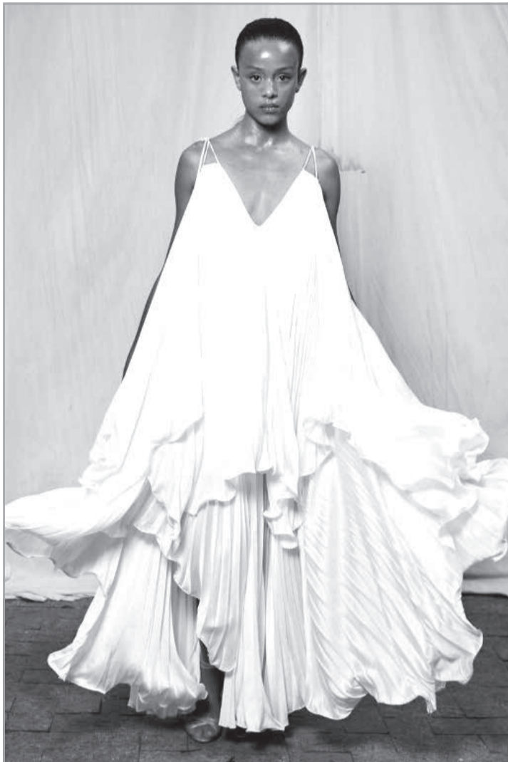
A Moda mineira em grande estilo

quem vai a BH até dezembro: é imperdível a mostra 'A Renda e a Chita', na Casa Fiat de Cultura. A expô celebra a diversidade e a riqueza das influências culturais, que formam a identidade fashion brasileira, além de