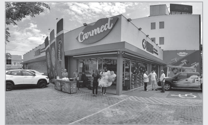
Inauguração contempla diversas ativações, como roletas premiadas e distribuição de brindes

Localizada estrategicamente na Avenida Brasil, 3.630, no centro da cidade, a unidade foi projetada para proporcionar uma jornada de compra diferenciada, alinhada às tendências internacionais do varejo. O ponto de venda conta com áreas personalizadas e interativas. "O lançamento desta loja reforça o compromisso da Farmácia Indiana com a inovação, sem abrir mão da qualidade e do atendimento