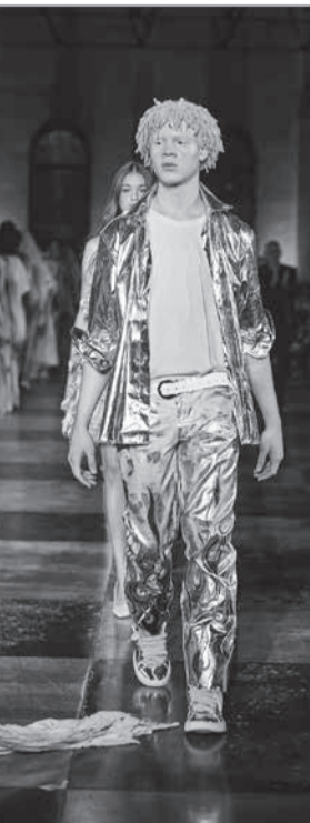
Criação de Jotta Sybbalena