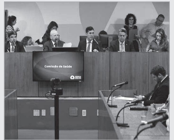
Também foi analisada proposição que institui o Dia Estadual do Cirurgião Oncológico

O substitutivo nº 2 corrobora os termos gerais sugeridos pela Comissão de Constituição e Justiça (CCJ), a qual analisou o projeto de lei anteriormente, mas propõe que a Relação Nacional de Equipamentos e Materiais Permanentes financiáveis para o SUS (Renem) seja utilizada como parâmetro para a compra de bens e contratação de serviços realizadas por hospitais públicos e filantrópicos. Tanto o projeto original quanto o substitutivo nº 1 apresentado na CCJ estabelecem como referência o Banco de Preços do Tribunal de Contas do Estado de