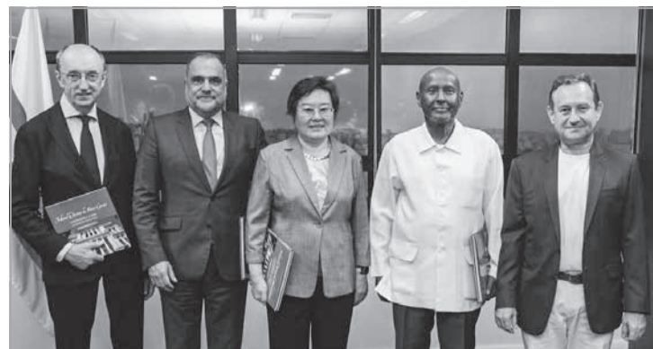
Juízes da Corte Internacional de Justiça estão em Belo Horizonte para participar do Congresso Diálogo das Cortes