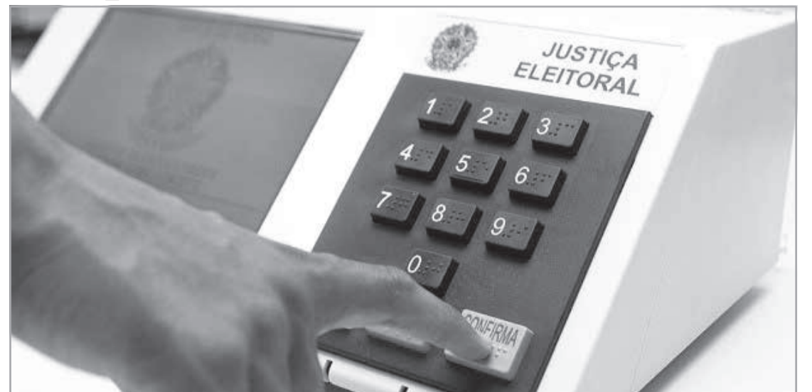
Segundo turno ocorre em cidades com mais de 200 mil eleitores em que um candidato não alcança a maioria absoluta dos votos válidos, ou seja, 50% mais um