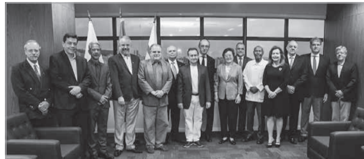
Encontro dos ministros da Corte Internacional com magistrados e parceiros do congresso foi realizado no TJMG