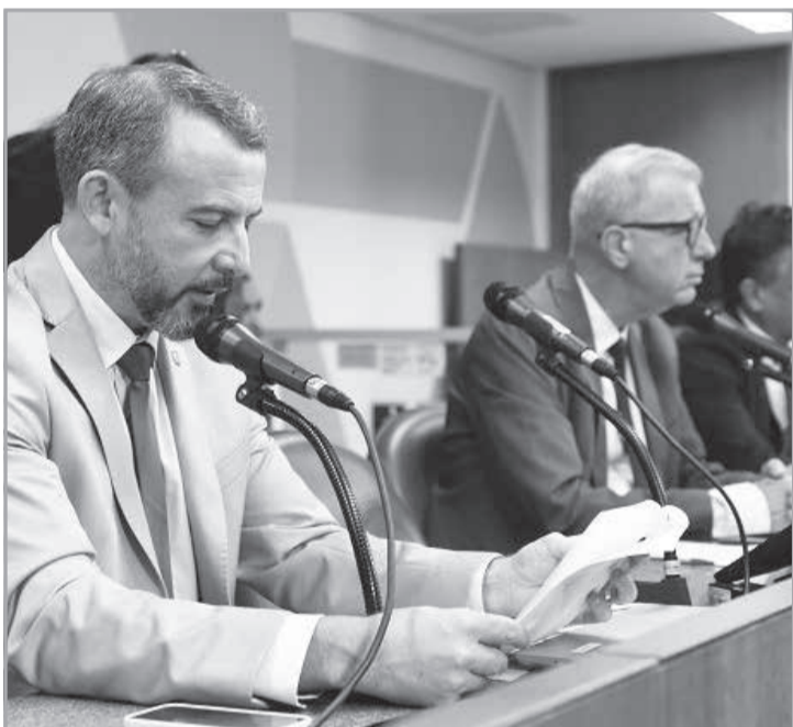
Também foram analisados, em 2º turno, projetos que instituem campanhas

Em relação ao conteúdo avaliado pela Comissão de Constituição e Justiça (CCJ), o substitutivo nº 1, o novo texto inova ao restringir a vedação de nomeação a condenados por crimes contra a dignidade sexual de crianças e adolescentes apenas nos casos em que esses cargos ou funções sejam para trabalhar com esse público infantojuvenil. “Essa restrição não impactaria, necessariamente, na redução dos crimes contra a dignidade sexual da criança e adolescente, uma vez que tais crimes ocorrem em sua maioria dentro da