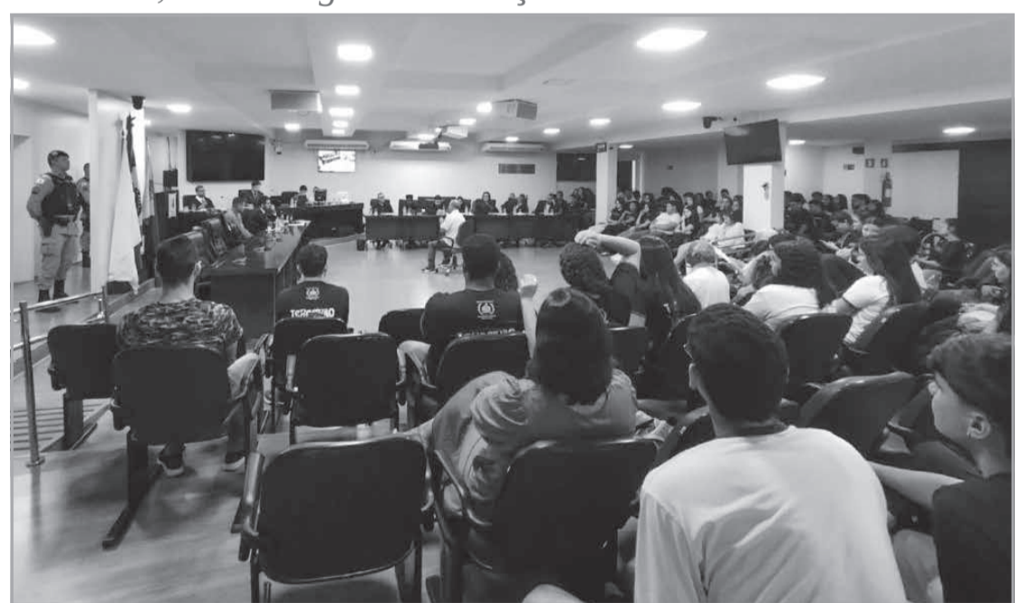
Três comarcas receberão mutirões do Tribunal do Júri a partir desta quarta-feira (30/10): Jequitinhonha, Grão Mogol e Conceição do Mato Dentro

Rua Pastor Hollerbach, 218 A • Grão Pará (33) 3522-3471 • (33) 98750-1641 • (33) 98750-1644 | Teófilo Otoni/MG