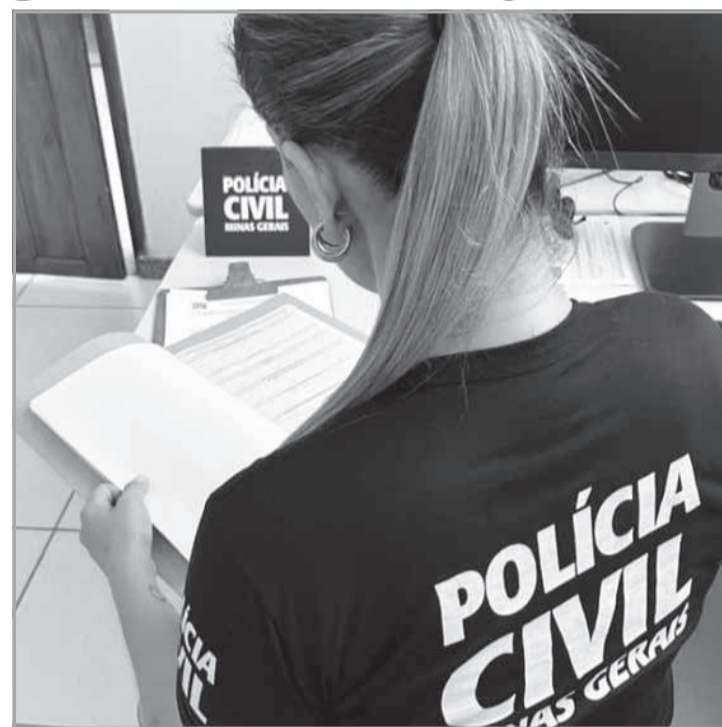
procedimento policial, o homem alegou que teria adquirido o documento em Belo Horizonte. Ele foi encaminhado ao sistema prisional, onde ficou à disposição da Justiça. (Informações/Foto: PCMG; dr. Thiago Carvalho).

A Polícia Civil de Minas Gerais prendeu em flagrante, em Araçuaí, região do Vale do Jequitinhonha, um homem, por uso de documento falso durante vistoria veicular. O homem compareceu à delegacia para realizar o procedimento de trânsito e apresentou uma carteira de habilitação que levantou suspeita do servidor responsável. Ao notar indícios de falsificação, o servidor acionou a equipe policial. Eles verificaram a carteira e confirmaram a fraude. O documento continha o número de uma carteira pertencente a outra pessoa, e foi constatado que o investigado não possuía habilitação válida, e ele foi preso na hora. Durante o