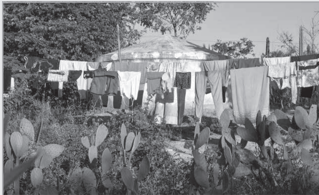
Programa de cisternas que garante água potável para a população do Norte de Minas é uma das boas práticas apresentadas na exposição

Crise climática é tema prioritário no Parlamento, que prepara uma agenda de atuação para aperfeiçoamento e fiscalização de políticas públicas