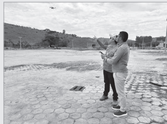
A programação do Sistema Faemg Senar para a semana inclui treinamentos como o de Operador Drone em Goiabeira e Conselheiro Pena, no Vale do Rio Doce

A programação inclui treinamentos como o curso de Adestrador de Animais em Carai, Defumação de Cames e Pescados em Bom Jesus do Galho, e Operador de Drone em Goiabeira e Conselheiro Pena. Outros destaques são os cursos de Eletricista Rural em Guanhões, Prevenção de Acidentes e Noções Básicas de Primeiros Socorros em