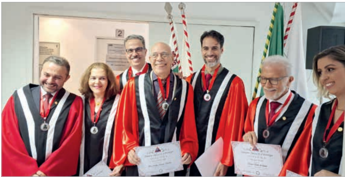
Sessão solene de posse da Academia Mineira de Odontologia