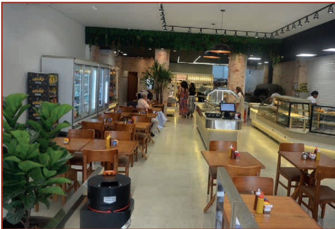
A Padaria Nova Delícia Premium conta com espaço amplo, climatizado e confortável