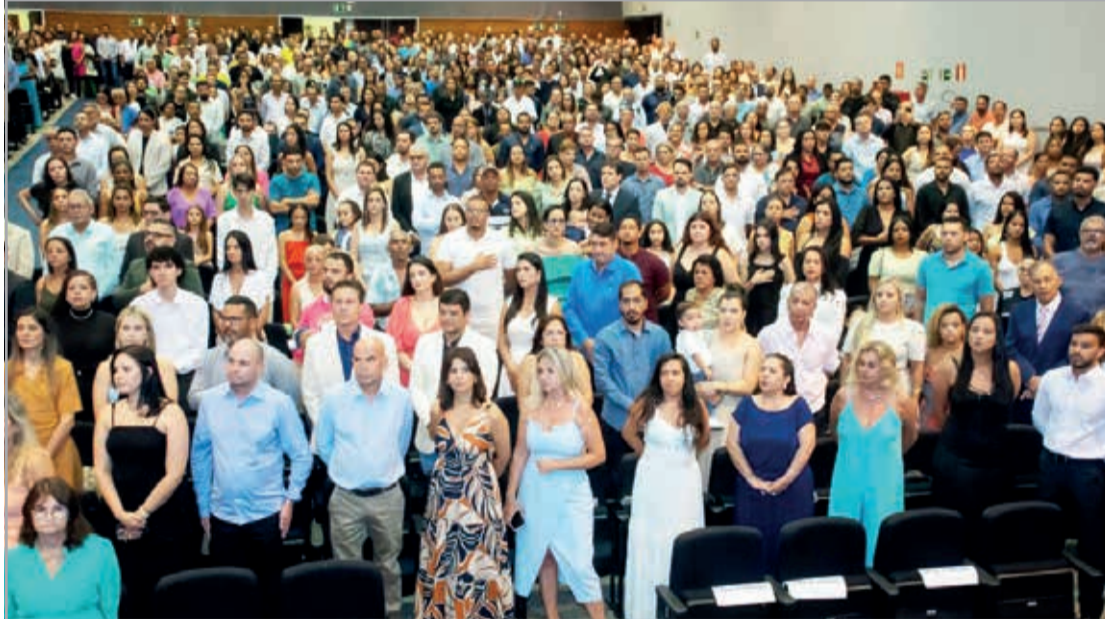
A solenidade foi bastante prestigiada no Centro de Convenções – Expominas, Teófilo Otoni

"Assumimos essa responsabilidade com muita humildade e determinação. Nosso compromisso é com o povo, e trabalharemos para fortalecer o diálogo entre a Câmara e a sociedade, sempre buscando atender às necessidades da população de forma transparente e eficiente", disse o novo presidente. A cerimônia de posse e a eleição da presidência simbolizaram o início de um novo ciclo político em Teófilo Otoni, com grandes expectativas para os próximos anos.