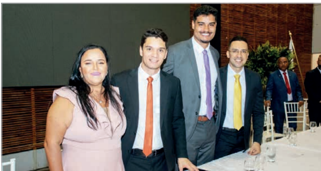
Composição da nova Mesa Diretora da Câmara Municipal de Teófilo Otoni (2025-2026)