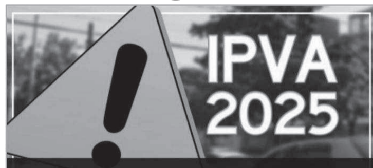
ESCALA DE VENCIMENTOS: