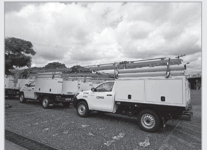
Para atuar no Cemig Agro, ao todo, foram adquiridas 83 novas caminhonetes, com tração nas quatro rodas, da marca Toyota, preparadas para enfrentar estradas sem pavimentação e em dias de chuva