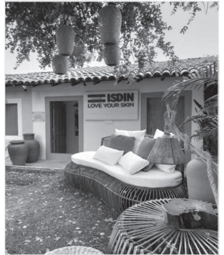
Casa oferece aos visitantes um mergulho pelo universo da marca ISDIN

Sobre a Farmácia Indiana - Uma das dez maio-