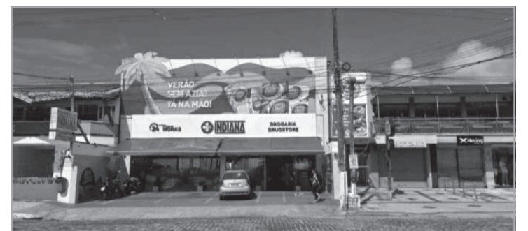
Collabs permitem ativações exclusivas e ações educativas de saúde