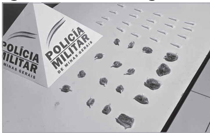
Leonardo, Alvino e Diego.

Ele foi preso em flagrante e conduzido à presença do delegado de Polícia Civil, juntamente com o mate-