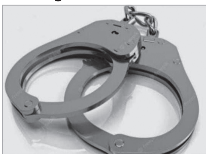
utilizar pistola elétrica para imobilizá-lo e prendê-lo. Os envolvidos foram conduzidos para a delegacia de Polícia Civil para as demais providências cabíveis à polícia judiciária. Equipe: tenente Vicenzo, sargento Hitalo, soldado Ramalho. (Informações: PMMG / Ataléia / Tenente Vicenzo).

Após tentativa de abordagem, segundo a polícia, diante da resistência, foi necessário