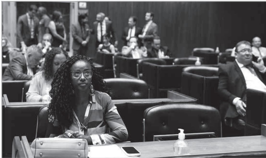
Proposta aprovada pelos parlamentares prevê participação da comunidade quilombola na construção do ensino multicultural e inclusivo