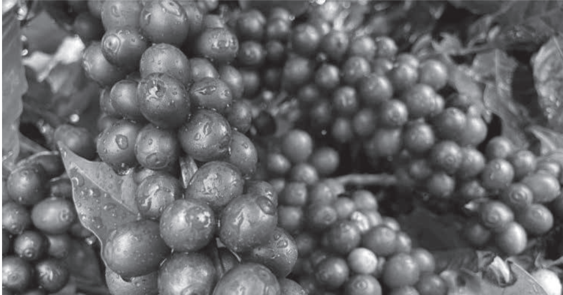
Café, minério de ferro, ouro e ferro-nióbio foram os produtos mais exportados pelo Estado

Balança de Minas tem superávit - A balança comercial de Minas Gerais alcançou um superávit de US$ 1,5 bilhão em fevereiro de 2025. Nos dois primeiros meses do ano as exportações mineiras totalizaram US$ 6 bilhões e as importações foram da ordem de US$ 2,9 bilhões, resultando em um superávit de US$ 3,1 bilhões. Varginha, Conceição do Mato Dentro, Paracatu, Nova Lima, Araxá e Guaxupé lideraram o comércio internacional do Estado, responsáveis, em conjunto, por quase US$ 1 bilhão das vendas para outros países. Os dados foram divulgados pela Secretaria de Comércio Exterior do Ministério do Desenvolvimento, Indústria, Comércio e Serviços (Secex/Mdic) e foram disponibilizados pela Fundação João Pinheiro (FJP). (Diário do Comércio – Belo Horizonte)