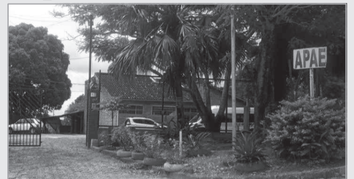
APAE de Ponte Nova fez a solicitação e recebeu, em dezembro, R$ 30 mil