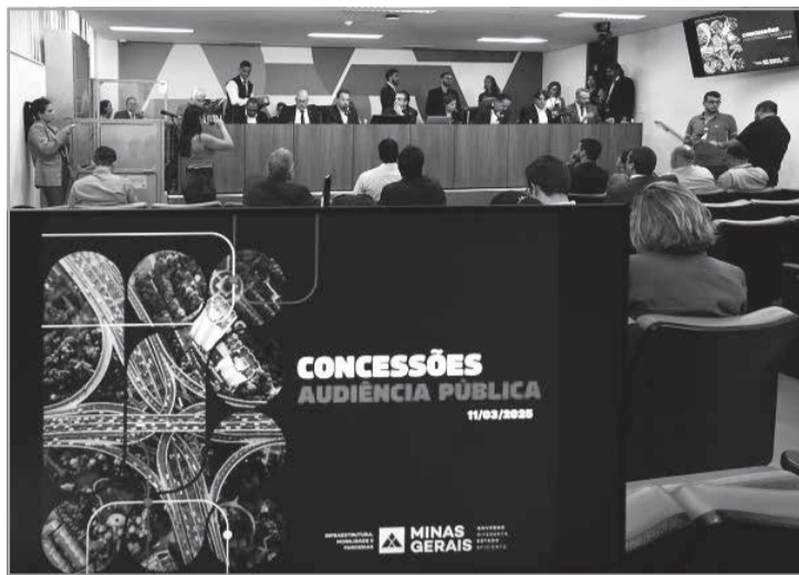
Na avaliação da Seinfra, a concessão vai garantir a diminuição de 30% no tempo de deslocamento e a revitalização do Vetur Norte na atração de investimentos

Concessão garantiria investimentos necessários e manutenções - A reunião foi aberta com uma apresentação do secretário de Estado de Infraestrutura, Mobilidade e Parcerias