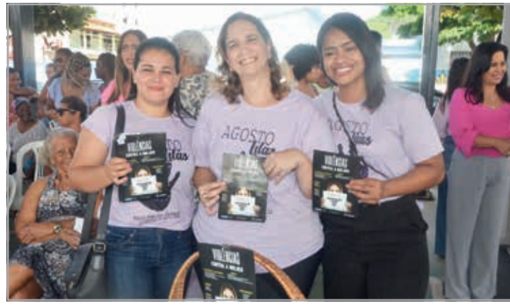
Campanha de orientação contra violência contra a mulher