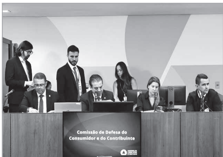
Na reunião, também foi apresentado um balanço das atividades do Procon Assembleia em 2024