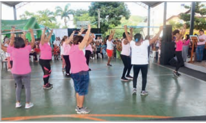
Momento "Zumba do CRAS" com a turma da Melhor Idade