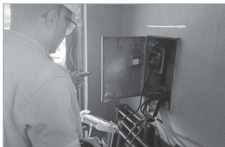
A Cemig realizou um mutirão de inspeções que mobilizou 22 equipes e mais de 50 profissionais em unidades consumidoras localizadas na Rua Alberto Cintra, na região Nordeste de Belo Horizonte, área tradicional de bares da capital mineira. Durante a ação, foram realizadas 396 inspeções, com a identificação de 20 irregularidades.

Para 2026, a Cemig prevê a execução de mais de 355 mil inspeções em toda a sua área de concessão, sendo mais de 58 mil na regional Leste de Minas. A am-