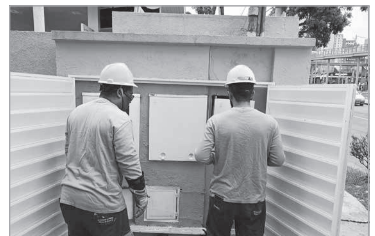
A Cemig realizou um mutirão de inspeções que mobilizou 22 equipes e mais de 50 profissionais em unidades consumidoras localizadas na Rua Alberto Cintra, na região Nordeste de Belo Horizonte, área tradicional de bares da capital mineira. Durante a ação, foram realizadas 396 inspeções, com a identificação de 20 irregularidades.

Consequências financeiras e criminais - Após a confirmação das irregularidades, os responsáveis devem ressarcir a Cemig pelo montante de energia consumida e não faturada, além de arcar com os cus-