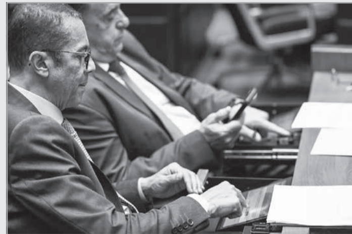
Parlamentares se reuniram em Plenário para apreciar 40 projetos de lei em pauta

Ingressos gratuitos para pessoas com TEA - Aprovado definitivamente