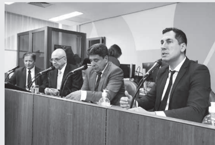
Comissão de Saúde aprovou parecer favorável ao texto que amplia as medidas de controle para casos de intoxicação por outras substâncias ou compostos químicos

Seguindo o parecer do relator, deputado Dou-