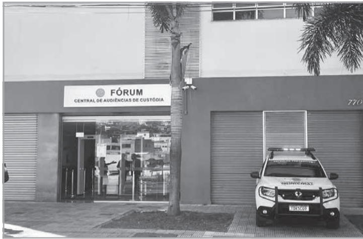
Motorista responde por homicídio culposo e lesão corporal culposa na direção de veículo automotor

A magistrada considerou a gravidade dos fatos — especialmente pela existência de uma vítima fatal e outra gravemente ferida — para impor medidas cautelares mais rigorosas. Além da fiança e da suspensão da CNH, o motorista deverá cumprir recolhimento domiciliar noturno durante a