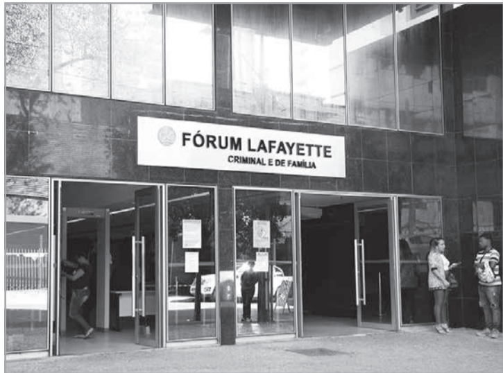
A decisão é do 1º Tribunal do Júri da comarca de Belo Horizonte

Segundo o Ministério Público, no dia do crime, agindo por motivo torpe, por