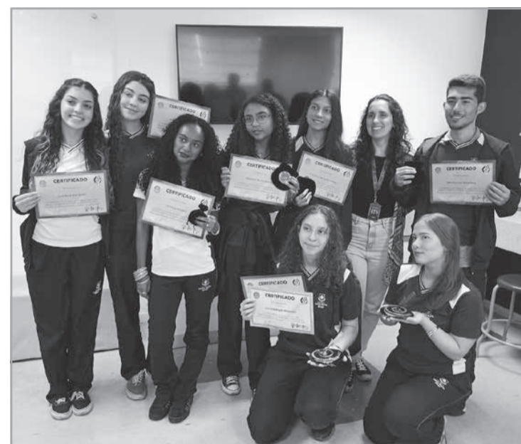
Centenas de alunos mineiros foram premiados nas últimas edições do Concurso da Abracopel