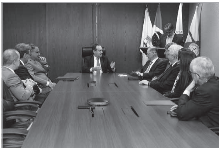
Presidente Corrêa Junior afirmou que o termo também visa identificar causas estruturais e demandas repetitivas