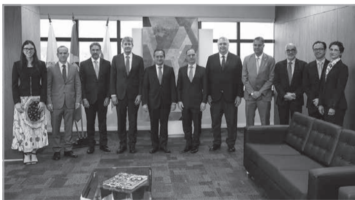
Cerimônia reuniu representantes do TJMG e da Cemig

do litígio para uma atuação mais preventiva, mais inteligente e mais cooperativa.”