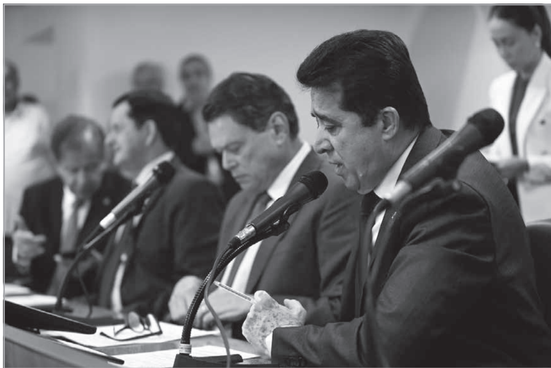
A Comissão de Fiscalização Financeira e Orçamentária analisa proposições.

Também estão prontos para votação em 1º turno projetos sobre cobrança de ITCD e a assistência a pacientes em tratamento de hemodiálise