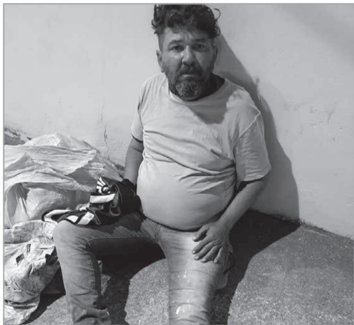
identificação do homem nem sobre eventual abordagem por parte das autoridades. (Imagens cedidas: Micharles Almeida Notícias. Por Ângela Almeida).