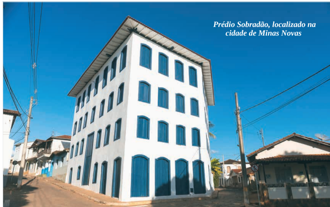
Prédio Sobradão, localizado na cidade de Minas Novas

Em uma parceria inédita no estado de Minas Gerais, a Instância de Governança Regional de Turismo Pedras Preciosas, que atualmente abrange municípios dos vales do Jequitinhonha, Mucuri e Rio Doce, iniciou uma série de ações voltadas ao desenvolvimento turístico regional. Página 8