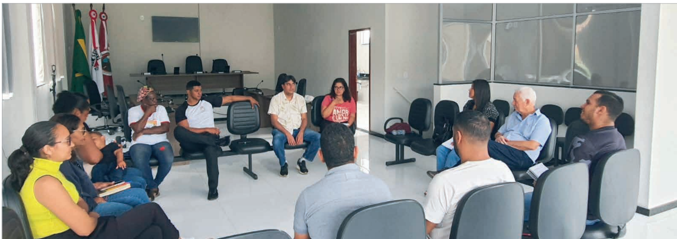
Encontro de sensibilização e mobilização turística no município de Jenipapo de Minas

E m uma parceria inédita no estado de Minas Gerais, a Instância de Governança Regional de Turismo Pedras Preciosas, que atualmente abrange 36 municípios dos vales do Jequitinhonha, Mucuri e Rio Doce, iniciou uma série de ações voltadas ao desenvolvimento turístico regional. As iniciativas são viabilizadas por meio de recursos oriundos de um convênio entre a Federação das Instâncias de Governança Regional de Minas Gerais (Fecitur) e a Companhia de Desenvolvimento de Minas Gerais (Codemge), em parceria com a Secretaria de Estado de Cultura e Turismo de