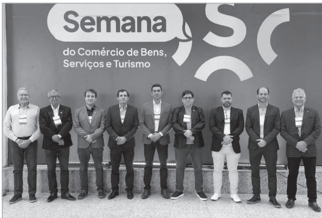
Evento reuniu lideranças empresariais e especialistas em inovação, empregabilidade e desenvolvimento do setor de comércio

Teófilo Otoni - A diretoria do Sindcomércio de Teófilo Otoni esteve em Belo Horizonte entre os dias 14 e 17 de maio para participar da Semana S, evento promovido pelo Sistema Fecomércio MG, Sesc e Senac. Realizada no Expominas, a programação incluiu atividades voltadas para a geração de empregos, saúde, bem-estar, inovação, qualificação e cultura, com foco no fortalecimento do setor de comércio de bens, serviços e turismo.