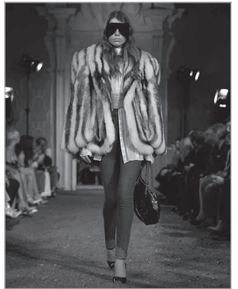
O luxo italiano de Valentino

Além das fronteiras brasileiras, o grupo paulistano está avançando esse modelo de "hospitalidade total" sobre cidades como Nova York, Miami, Londres e Milão (onde comprou o Palazzo Medici del Vascello) e fez uma estratégia aquisição em Punta del Este - o icônico Conrad. Resumo da ópera: o luxo moderno não é sobre o que você usa, mas sobre como — e onde — você escolhe viver cada minuto.