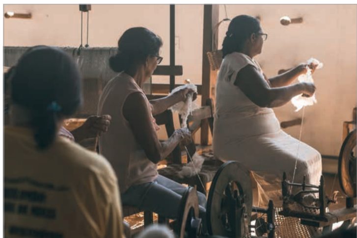
Tecelãs da Comunidade de Tocoíós de Minas, no Município de Francisco Badaró

Ação realizada com recursos de convênio da Fecitur e Codemge, em parceria com a Secult-MG. Governo de Minas. Aqui o Trem Prospera!