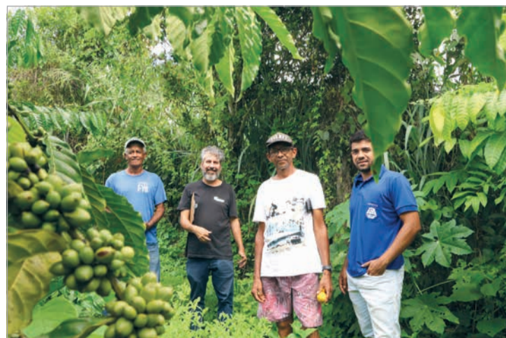
Atendimento individual com produtores rurais do município de Novo Oriente de Minas