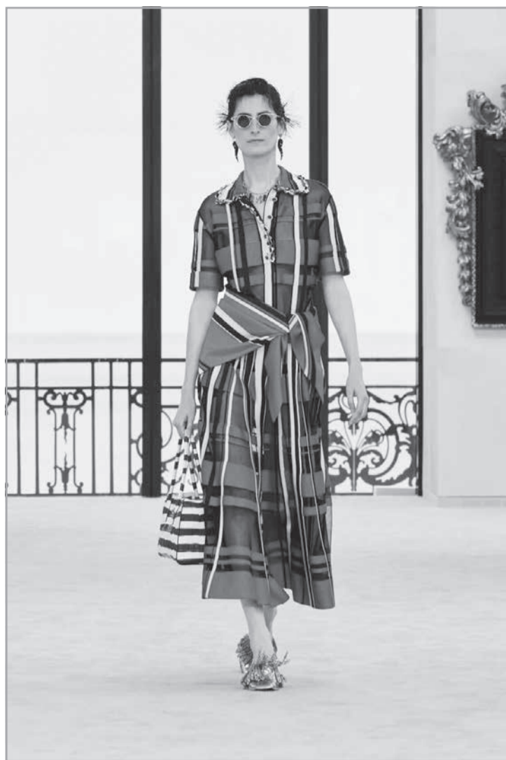
Chanel em Biarritz: cor & calor

VAIVÉM - Os salões de negócios de moda Con-