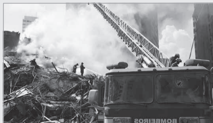
Em maio de 2018, um incêndio de grandes proporções registrado em São Paulo, causado por um curto-circuito em uma tomada de um cômodo no quinto andar, causou o desabamento do edifício Wilton Paes de Almeida, deixando moradores feridos gravemente

associado a 19 incidentes e cinco óbitos. Diante desse cenário, a Cemig reforça medidas simples para reduzir os riscos dentro de casa.