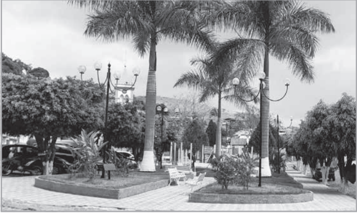
Prefeitura de Rochedo de Minas fez consulta ao Tribunal sobre o tema – Foto: Circuito Turístico Caminhos Verdes de Minas / Reprodução

O Tribunal de Contas do Estado de Minas Gerais (TCEMG) tomou uma importante decisão no combate a irregularidades em consórcios públicos mineiros. Na última sessão do Pleno, na quarta-feira (29/4), o TCEMG determinou que as penalidades de impedimento de licitar e contratar, aplicadas aos consórcios em casos de anormalidades detectadas, devem ser estendidas aos municípios consorciados, independentemente da edição de regulamentação local específica.