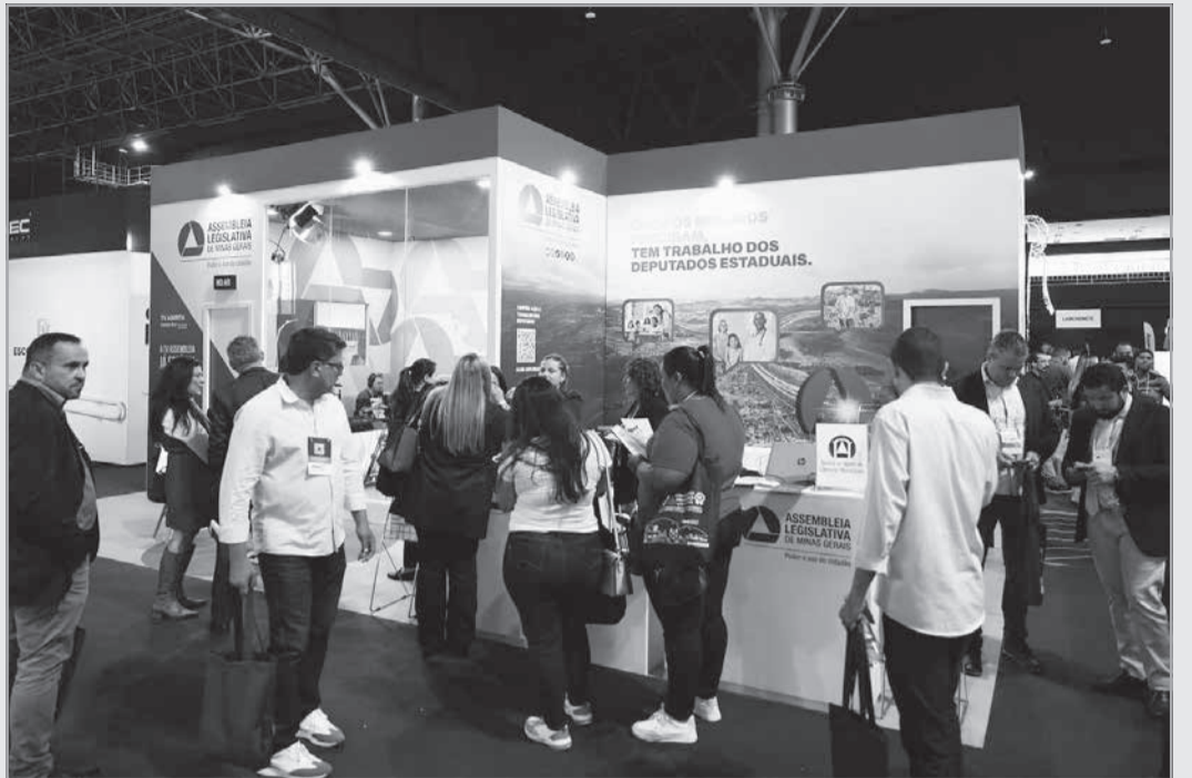
Parceira do congresso, ALMG volta a ter estandes para divulgação de serviços como no ano passado

Estande do Legislativo Estadual terá atendimento do Centro de Apoio às Câmaras e estúdio da TV para transmissões ao vivo