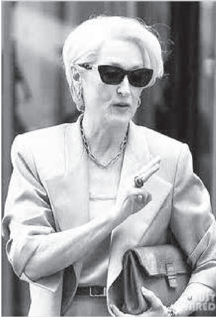
Meryl Streep em cena do filme

-A feira Prime Off ampliou suas edições, após resultados positivos no Rio de Janeiro - onde reuniu dezenas de marcas e milhares de consumidores em eventos temporários de descontos fashion. O modelo mistura outlet premium, experiência social e consumo rápido, ocupando espaços urbanos por períodos curtos, geralmente entre três e cinco dias. Em Minas a expectativa é reunir marcas de moda fe-