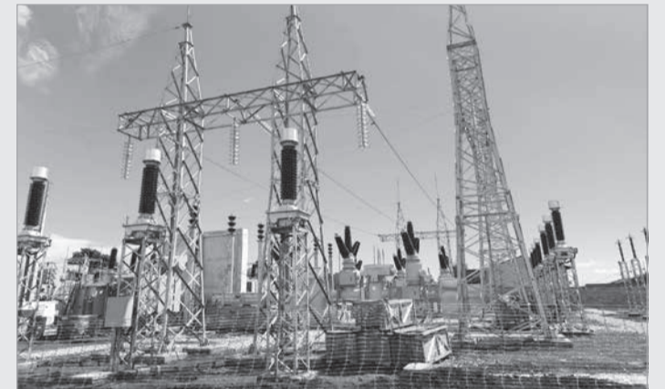
Principal foco do plano de investimentos da Cemig, o segmento de distribuição concentrou R$ 1,28 bilhão nos três primeiros meses de 2026

tida (RAP) à companhia, o que representa um crescimento de 45,2% em relação ao mesmo período de 2025, reforçando a eficiência e o retorno dos investimentos realizados.