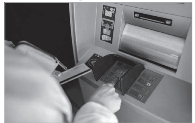
Desembargadores determinaram envio do processo ao Ministério Público para investigação

Descontos indevidos - O processo teve início quando a aposentada percebeu descontos de R$ 1.573,68 em nome de uma entidade à qual nunca havia se filiado. Em sua defesa, o sindicato argumentou que a adesão