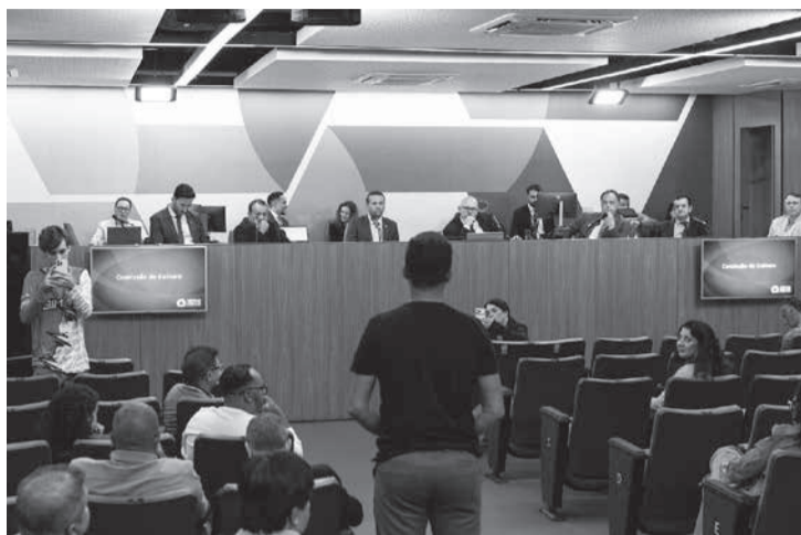
Produtores de eventos participaram do debate sobre limites para gastos públicos com shows