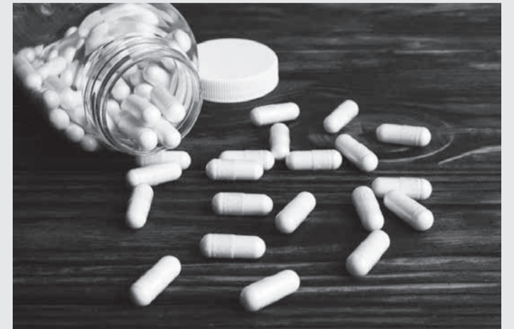
Prefeitura de Itaú de Minas não poderá multar estabelecimento por funcionar aos domingos e aos feriados

A empresa questionou, na Justiça, a legalidade de uma lei complementar municipal que limitava o funcionamento de farmácias nesses dias apenas às unidades de plantão. A drogaria argumentou que a