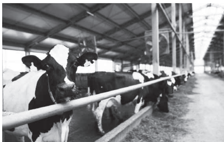
Pecuarista deve ser indenizado pelas perdas materiais que registrou ao ficar cerca de 35 horas sem energia em Patos de Minas (Crédito: Envato Elements / Imagem ilustrativa)

A concessionária negou falha na prestação de servi-