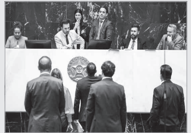
Projeto que permite a venda de imóveis do Estado foi aprovado com alterações definidas no Plenário

• retirada das seguintes propriedades da lista de imóveis que podem ser vendidos: o Centro Mineiro de Referência em Resíduos (CMRR), de Belo Horizonte; a sede do Departamento de Estradas de Rodagem de Minas Gerais (DER-MG) em Araçuaí (Jequitinhonha); a Fazenda Sítio Novo, da Fundação Caio Martins, em Esmeraldas (Região