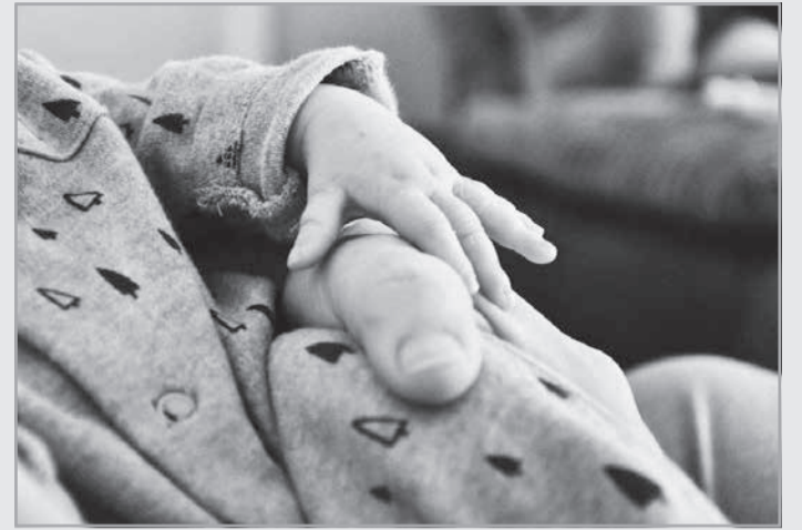
Ausência de compreensão pelo recém-nascido não afasta ocorrência de danos morais

Resumo em linguagem simples: Erro em diagnóstico gerou internação desnecessária de recém-nascido - Justiça entendeu que ausência de compreensão pelo recém-nascido não afasta a caracterização do dano moral - Laboratório foi condenado a pagar indenização por danos morais aos pais e à criança.