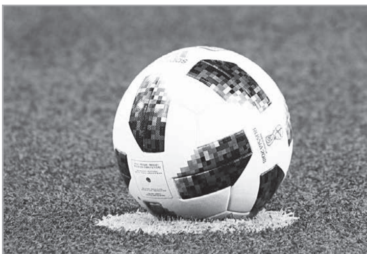
Caso aconteceu durante partida da Copa Libertadores no Mineirão (Crédito: Imagem ilustrativa)

"Ao praticar tais condutas em ambiente público, com grande concentração de pessoas e em contexto de atividade esportiva profissional - circunstâncias