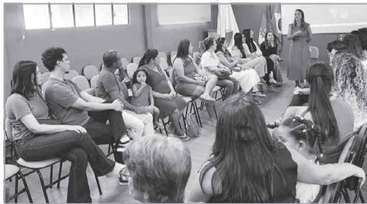
Encontro alcançou em torno de 20 pessoas e procurou apresentar aspectos variados da escolha pela adoção