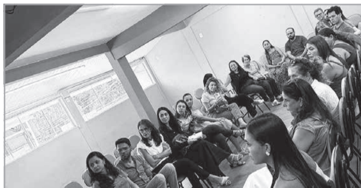
O contexto das crianças, os desafios dos futuros pais e a oportunidade de esclarecer dúvidas foram abordados no evento

tro: estimular uma reflexão mais consciente, humana e responsável sobre a adoção.