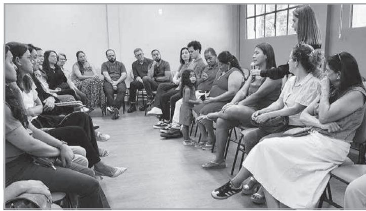
Realizado pela 3ª vez na Comarca de Teófilo Otoni, encontro permitiu reflexão e diálogo entre pretendentes e famílias que já adotaram

“Mais do que uma etapa formal do processo, esses encontros representam uma oportunidade essencial de reflexão sobre a realidade da adoção no Brasil e, especialmente, sobre o perfil das crianças e dos adolescentes que aguardam uma família. Iniciativas como essas fortalecem a proteção integral, porque colocam no centro da discussão os direitos, as necessidades e a dignidade das crianças e dos adolescentes acolhidos, promovendo uma cultura de adoção mais consciente, responsável e baseada no afeto”, afirmou a juíza.