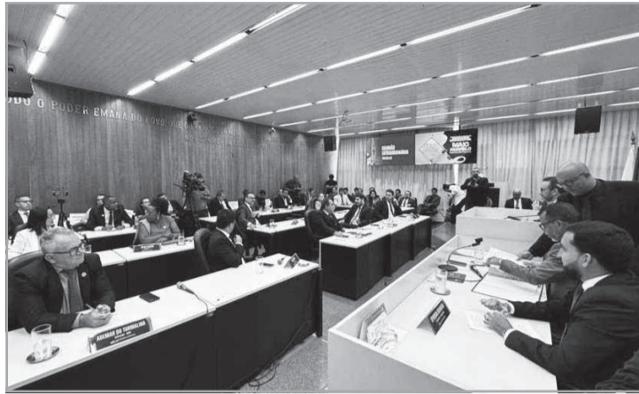
Foi um dia histórico para Governador Valadares, que pela primeira vez na sua história, tem um prefeito afastado do cargo pelo Poder Legislativo

Profissionalização na APAC Divinópolis - AAPAC Divinópolis segue investindo na capacitação profissional como ferramenta de