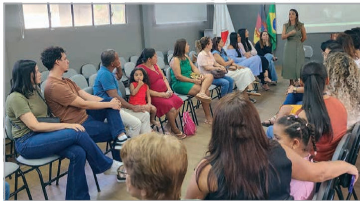
Encontro alcançou em torno de 20 pessoas e procurou apresentar aspectos variados da escolha pela adoção