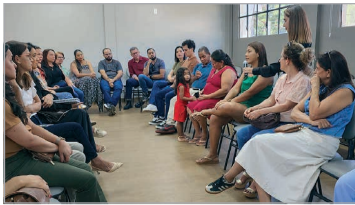
Realizado pela 3ª vez na Comarca de Teófilo Otoni, encontro permitiu reflexão e diálogo entre pretendentes e famílias que já adotaram

“Mais do que uma etapa formal do processo, esses encontros representam uma oportunidade essencial de reflexão sobre a realidade da adoção no Brasil e, especialmente, sobre o perfil das crianças e dos adolescentes que aguardam uma família. Iniciativas como essas fortalecem a proteção integral, porque colocam no centro da discussão os direitos, as necessidades e a dignidade das crianças e dos adolescentes acolhidos, promovendo uma cultura de adoção mais consciente, responsável e baseada no afeto”, afirmou a juíza.