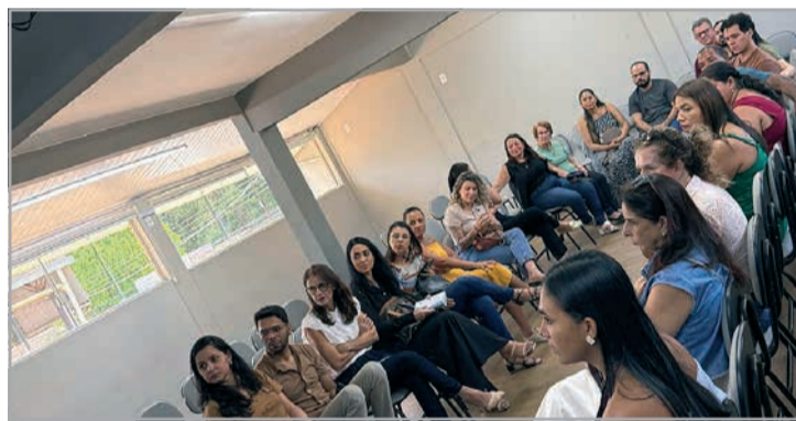
O contexto das crianças, os desafios dos futuros pais e a oportunidade de esclarecer dúvidas foram abordados no evento

tro: estimular uma reflexão mais consciente, humana e responsável sobre a adoção.