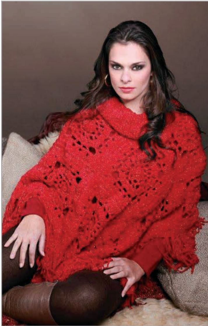
O aconchego invernal do poncho em tricô

-- O varejo de luxo está consolidando a estratégia de abrir pop-up stores imersivos em balneários exclusivos, como Saint-Tropez, Sardenha, Capri & outros. Essas ativações sazonais transformam espaços em experiências instagramáveis, criando um senso de exclusividade e desejo imediato. No Brasil, esse fenômeno de ocupação litorânea no verão ocorre, com des-