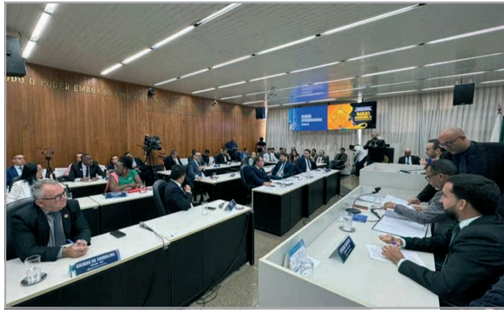
Foi um dia histórico para Governador Valadares, que pela primeira vez na sua história, tem um prefeito afastado do cargo pelo Poder Legislativo

Profissionalização na APAC Divinópolis - AAPAC Divinópolis segue investindo na capacitação profissional como ferramenta de