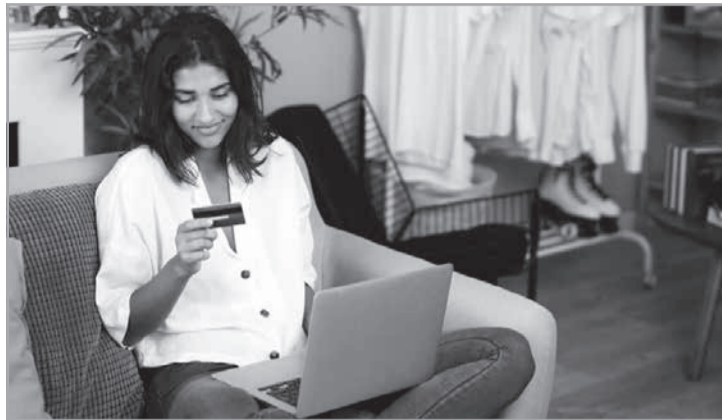
Estado é o segundo maior emissor de vendas digitais

Audiência discute expansão do Jaíba - A expansão do Projeto Público de Irrigação Jaíba, no Norte de Minas, avançou mais uma etapa, com a realização de uma audiência pública promovida pela Codevasf no município de Jaíba. O encontro reuniu