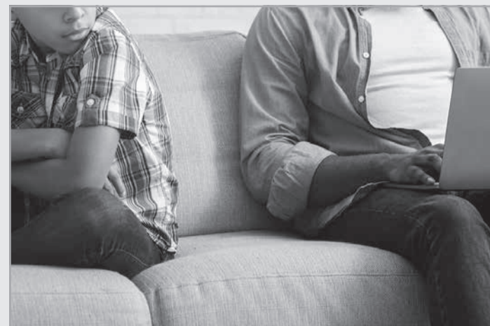
O TJMG negou pedido de homem que buscava anular o registro de paternidade de uma criança (Crédito: Envato Elements / Imagem ilustrativa)

O autor da ação alegou que não possuía vínculo afetivo com a criança, em função de falta de contato e desinteresse da mãe. Ele afirmou que, mesmo sabendo que não era o pai biológico, decidiu registrá-la por ter se sentido “indiretamente forçado” pela mãe para que a criança não crescesse sem registro paterno. Ainda conforme o autor, teria havido cerceamento de defesa pela falta de autorização do exame de DNA, e a manutenção de uma “paternidade fictícia” causaria insegurança e desajuste emocional à criança futuramente.