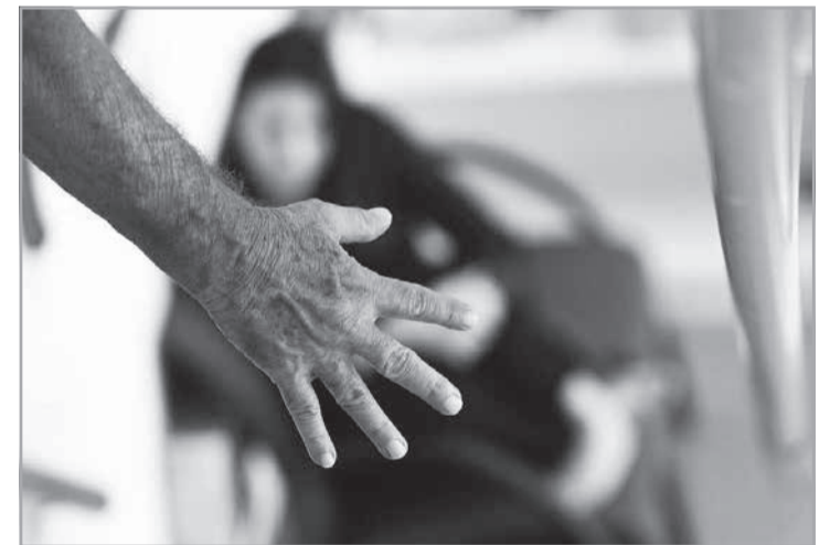
Pena reduzida pelo Núcleo de Justiça 4.0 – Criminal Especializado deve ser cumprida em regime semiaberto

A defesa do agressor interpôs recurso de apelação requerendo a reforma