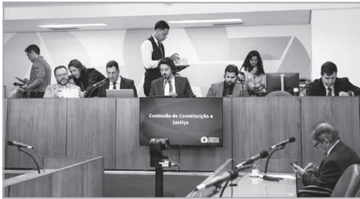
A Comissão de Constituição e Justiça analisou uma série de proposições nesta terça-feira (19)

Caso a carga horária mensal exceda os limites previstos, a proposta garante a concessão de descanso compensatório proporcional. Esse descanso deverá ser acordado com a chefia imediata e usufruído em até 12 meses subsequentes ao mês em