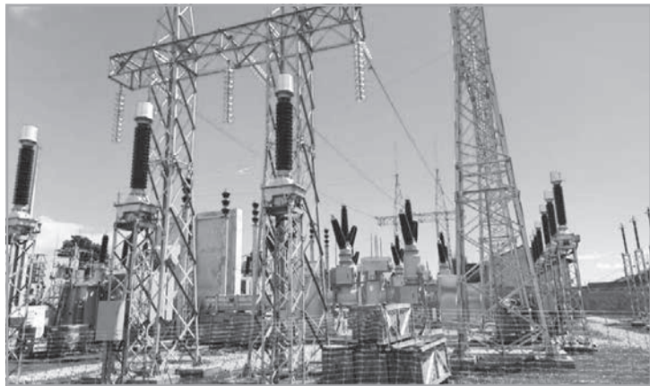
Valor aplicado pela Cemig em Minas cresceu 22% em relação ao mesmo período do ano passado

Na véspera do Dia do Gari, celebrado no Brasil em 16 de maio, os servidores do Demlurb realizaram um ato no Centro de Juiz de Fora. O objetivo foi reivindicar a aprovação do Projeto de Lei que regulamenta a profissão de gari e estabelece o piso salarial nacional de R$ 3.036 para a categoria. A convocação foi promovida pelo Sindicato dos Servidores Públicos Municipais de Juiz de Fora (Sinsperpu-JF). Conhecido como PL do Gari, o texto já foi aprovado na