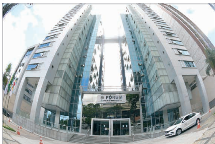
A decisão é da 11ª Vara Cível da Comarca de Belo Horizonte