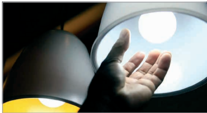
A Cemig alerta que cerca de 1,1 milhão de clientes que teriam direito aos benefícios da Tarifa Social de Energia Elétrica (TSEE) e do Desconto Social ainda não recebem o abatimento na conta de luz devido a inconsistências cadastrais

que bloqueia a concessão automática do desconto. A situação é comum em casos de aluguel ou moradia cedida.