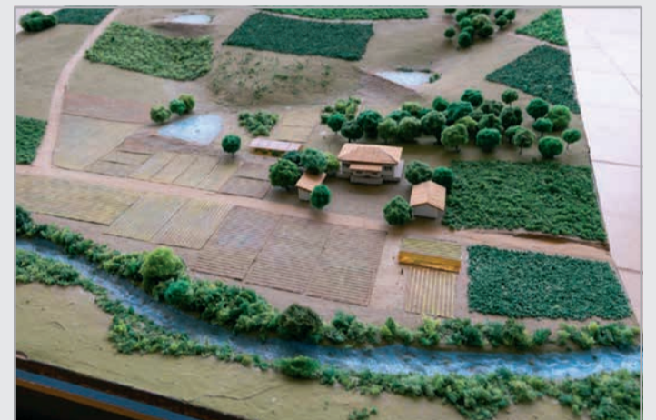
Maquete explicativa do projeto Vitrine de Barraginhas, a ser apresentada nos Dias de Campo, em Mirabela, Periquito e Virgem da Lapa

Após o lançamento, haverá visitas técnicas, chamadas "Dias de Campo", às regiões contempladas pelo projeto, sendo: - Mirabela, no Norte de Minas, na região do Córrego do Salto, no dia 29/5; -- Periquito, no Vale do Rio Doce, na região do Córrego da Chieira/São Sebastião do Baixio, na Comunidade Quilombola Ilha Funda, no dia 8/6; -Virgem da Lapa, no Vale do Jequitinhonha, na região do Córrego do Onça, no dia 19/6.