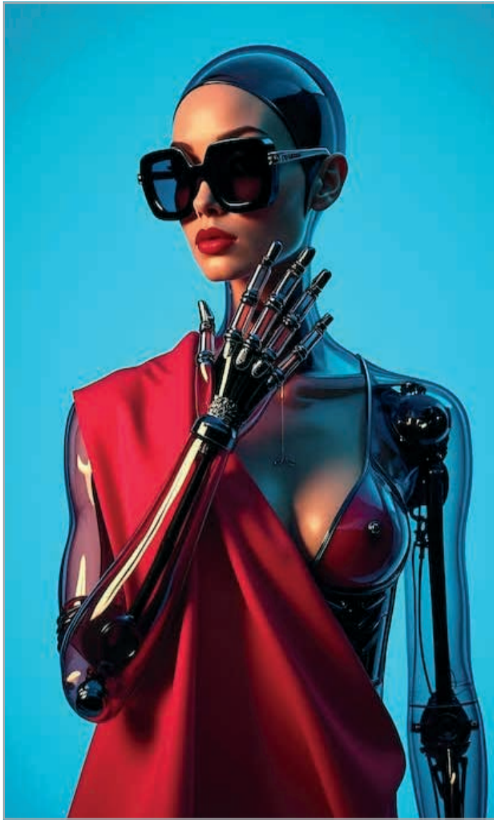
Moda e robótica: integração produtiva

* Algumas grifes europeias (como Chanel, Gucci, Dior e Louis Vuitton) voltaram a apostar fortemente nos Estados Unidos com desfiles grandiosos em Nova York e Los Angeles. A mudança ocorre pela desaceleração do mercado chinês e pelas incertezas no Oriente Médio, tornando os EUA um mercado mais seguro e lucrativo. Além das vendas, o país segue como referência cultural global, garantindo enorme repercussão nas redes sociais, presen-