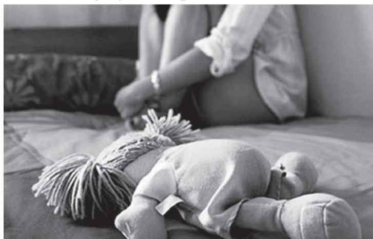
Abusos foram cometidos ao longo de três anos (Crédito: Imagem Ilustrativa)

Os abusos continuaram até 2025, data em que a vítima já havia completado 14 anos. A partir daí, os cri-