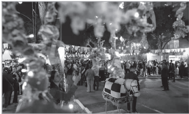
Os enfeites jamais devem ser fixados em postes ou braços de iluminação pública. Também não é recomendada, em hipótese alguma, a utilização de arames ou materiais metálicos na instalação de bandeirinhas e ornamentações

mo Júnior destaca ainda que os enfeites jamais devem ser fixados em postes ou braços de iluminação pública e que arame ou outros materiais metálicos não devem ser utilizados na sustentação de bandeirinhas e ornamentações. Além disso, é importante manter distância mínima de 1,5 metro da rede elétrica para evitar riscos em situações de ventania ou deslocamento das estruturas. Outro elemento tradicional das festas juninas que exige atenção são as fogueiras. A recomendação é que sejam montadas longe da rede elétrica, da vegetação e de áreas de circulação intensa de pessoas. Em períodos mais secos, o risco de incêndios aumenta e os cuidados precisam ser redobrados.