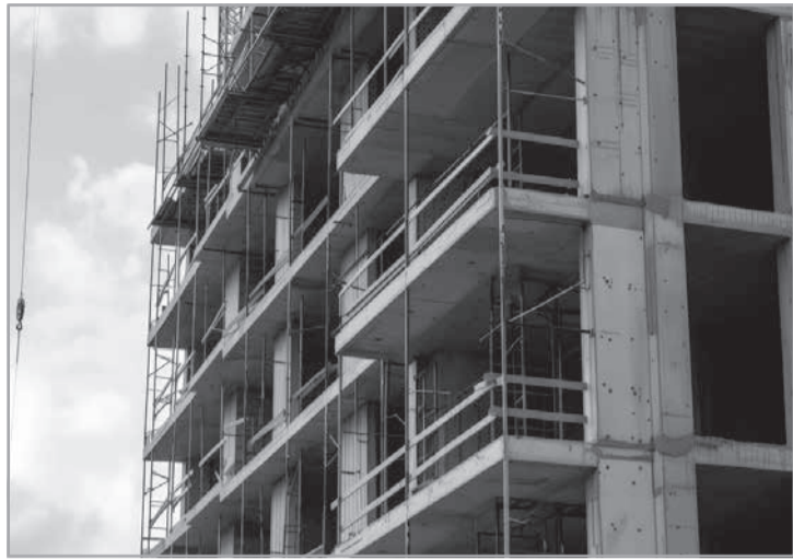
O 5º Núcleo de Justiça 4.0 – Cível Privado do TJMG manteve decisão da 29ª Vara Cível de Belo Horizonte sobre falhas encontradas após entrega de apartamento

Recurso - Como a 29ª Vara Cível da Comarca de Belo Horizon-