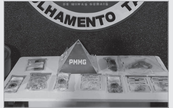
CMD Tático 33671, Tático Móvel 36283, Tático Móvel 36282, AOp. 15ª RPM-19º BPM – 74ª Cia TM - Teó-

Produtividade: 1 menor apreendido, 1 maior presa, 28 porções de maconha, 17 pedras de crack, 7 microtubos com cocaína, R$ 430,00. Equipes: