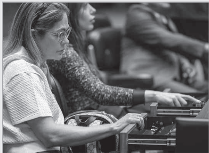
Projeto que garante assistência a públicos mais vulneráveis em situação de calamidade já pode seguir para a sanção do governador.

Na prática, o texto especifica medidas que o Estado pode adotar para a garantia de atendimento psicológico especializado; criação de espaços adequados e seguros para mulheres, crianças e adolescentes; assistência socioassistencial e outras ações relativas a políticas para proteção desses públicos.