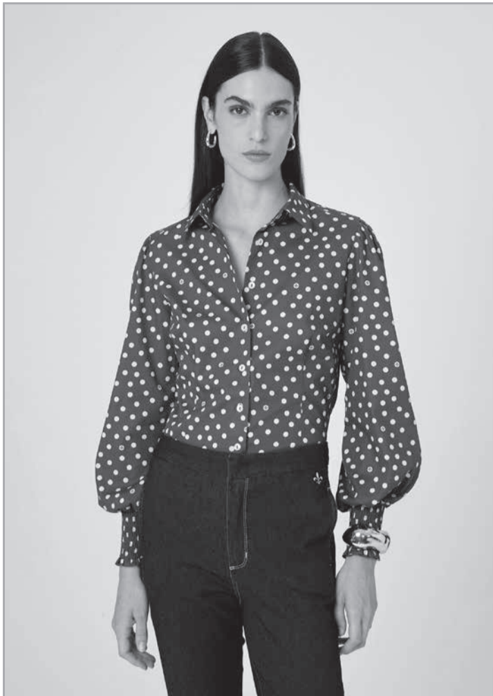
Camisaria da Dudalina