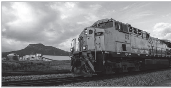
Trecho Corinto-Aratu, entre Minas Gerais e Bahia, é estratégico para escoamento da produção norte-mineira