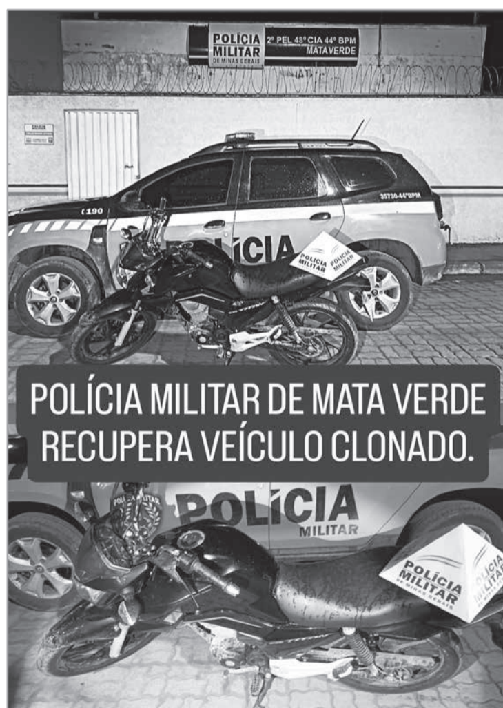
POLÍCIA MILITAR DE MATA VERDE RECUPERA VEÍCULO CLONADO.

Após consulta e verificação minuciosa, constatou-se que o veículo se tratava de um clone, sendo identificado o original na cidade de Teresina - PI. Diante dos fatos, a motocicleta foi apreendida e foi removida ao pátio credenciado para as demais providências legais, o condutor foi preso e conduzido à polícia judiciária para as providências cabíveis.