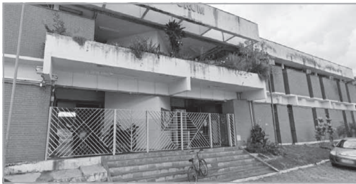
Caso de agressão com amputação foi registrado em Carlos Chagas, no Vale do Mucuri

O Estado se defendeu, alegando que o ataque foi um "ato imprevisível de terceiro" e