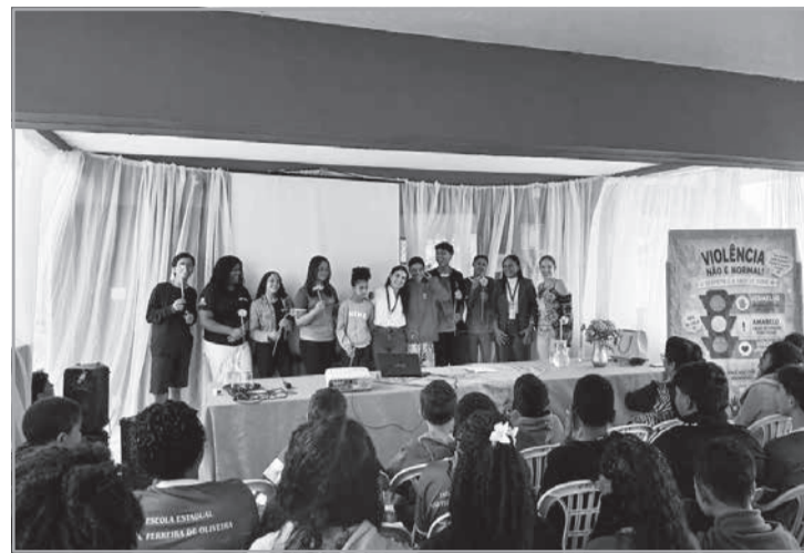
Palestras em escolas públicas da Comarca de Teófilo Otoni foram voltadas para a campanha "Maio Amarelo"

Em parceria com a Central de Serviço Social e Psicologia do município, as intervenções buscaram contribuir para fortalecer o papel da escola como espaço privilegia-