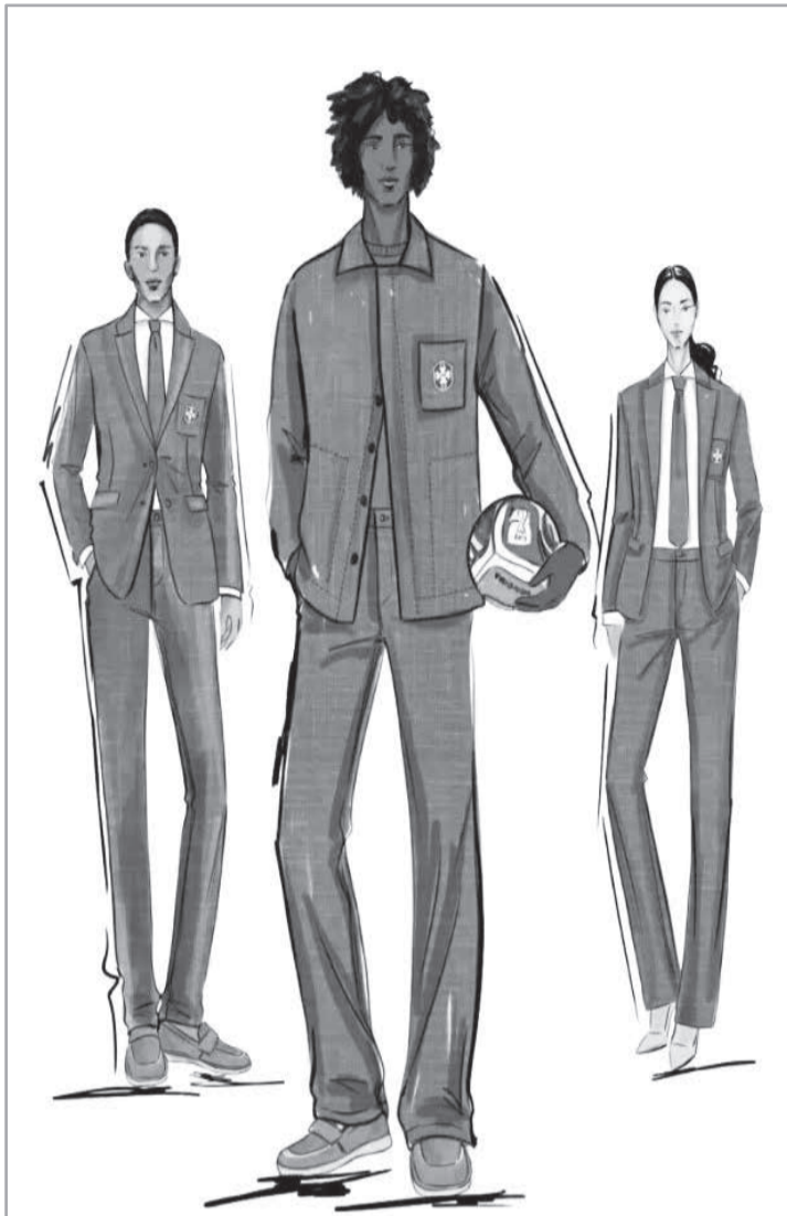
Croquis do uniforme social da nossa Seleção de Futebol 2026

** A Copa reforça a liderança de grandes marcas esportivas nos uniformes das seleções. A Nike veste equipes como Brasil, França e Inglaterra, enquanto a Adidas segue forte com Alemanha, Argentina e Espanha. A Puma amplia sua presença em mercados estratégicos da Europa e da África. Nos Estados Unidos, marcas locais aprovei-