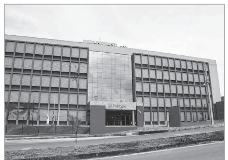
Acórdão confirmou sentença da Comarca de Formiga

A decisão confirmou que o proprietário do veículo responde solidariamente pelos danos causados por quem ele autorizou a dirigir. No caso, como o dono do veículo era o pai já falecido do réu, os herdeiros (o próprio réu, a mãe e o irmão) respondem pela obrigação: "O proprietário responde pelos danos causados por terceiro a quem confiou o bem, independentemente de autorização expressa para aquele momento