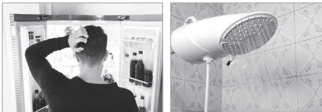
Simples mudanças de comportamento no uso de eletrodomésticos e da iluminação podem reduzir significativamente o consumo nas residências

Tomar banho, abrir a geladeira, utilizar ventiladores, ligar o ar-condicionado ou preparar alimentos na cozinha. Atividades simples da rotina podem representar uma parcela importante do consumo de energia dentro de casa. Com pequenas mudanças de hábito e maior atenção ao uso dos equipamentos elétricos, é possível reduzir desperdícios e economizar na conta de luz sem abrir mão do conforto. Essas medidas são ainda mais importantes com o reajuste das tarifas da Cemig, vigente desde 28 de maio, e com a bandeira amarela anunciada pela Aneel na última sexta-feira (29/5).