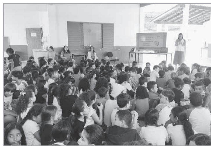
O objetivo foi promover a conscientização de estudantes sobre as múltiplas formas de violência sexual infantojuvenil

do de informação, escuta e encaminhamento, em consonância com as diretrizes do Sistema de Garantia de Direitos (SGD).