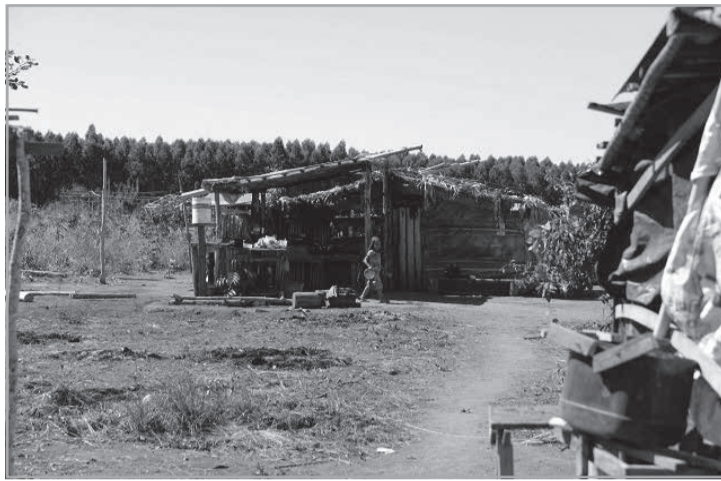
Representantes de ocupações e acampamentos no Estado foram chamados para a audiência da Comissão de Direitos Humanos

Chamam atenção para casos emblemáticos recentes de violência no campo em Minas Gerais, os quais resultaram na morte de militantes ou na necessidade da inclusão de vítimas no Programa de Proteção aos Defensores de Direitos Humanos, Comunicadores e Ambientalistas (PPDDH). Além disso, a deputada bus-