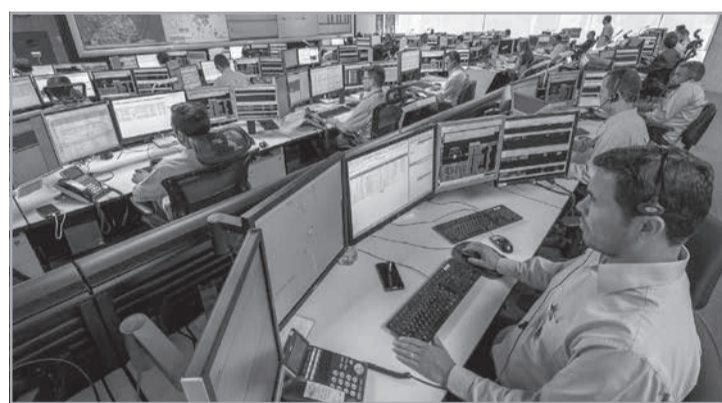
A Cemig monitora, em tempo real e em escala 24 x 7, o comportamento do sistema elétrico e, na Copa do Mundo, esta operação ganha atenção especial

Além disso, a companhia realizará monitoramento contínuo das condições meteorológicas, já que eventos climáticos podem impactar diretamente o sistema elétrico, especialmente em períodos de