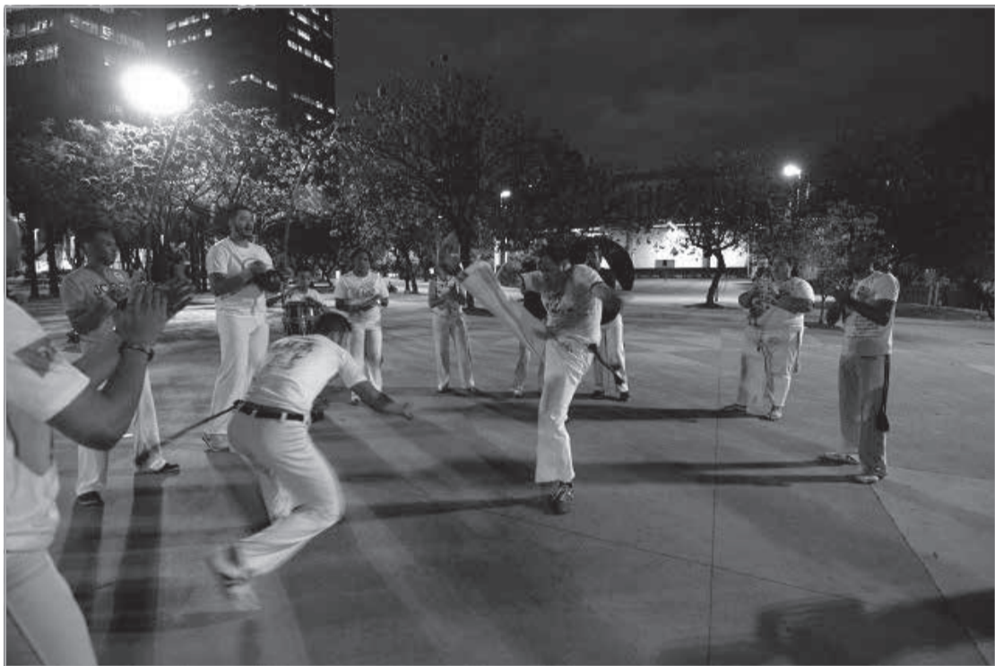
A abordagem da capoeira no ensino fundamental e médio contará, preferencialmente, com a participação de mestres e profissionais reconhecidos.

Nova lei reconhece o papel da expressão cultural na formação da sociedade brasileira