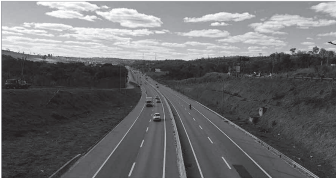
Concessão terá duração de 30 anos, inclui duplicações, contorno de Teófilo Otoni e pedágio eletrônico sem praças físicas a partir de dezembro de 2026

EcoRodovias assume BR-116 e BR-251 - A concessionária EcoRodovias assinou o contrato de concessão dos trechos das BRs 116 e 251 entre Minas Gerais e Bahia e será responsável pela administração de 734,9 quilômetros de rodovias pelos próximos 30 anos. A formalização foi publicada pela Agência Nacional de Transportes Terrestres (ANTT) e prevê investimentos de R$ 13,1 bilhões ao longo da concessão. Do total, R$ 7,3 bilhões serão destinados a obras de ampliação da capacidade viária e R$ 5,8 bilhões para operação e manutenção das rodovias. (Por Dentro de Minas) https://pordentrodeminas.com.br