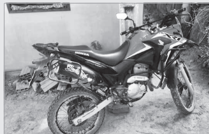
70º BPM - O AGUERRIDO - MEDINA/MG - Polícia Militar de Minas Gerais, 251 anos: A força do povo mineiro. Presença que protege.