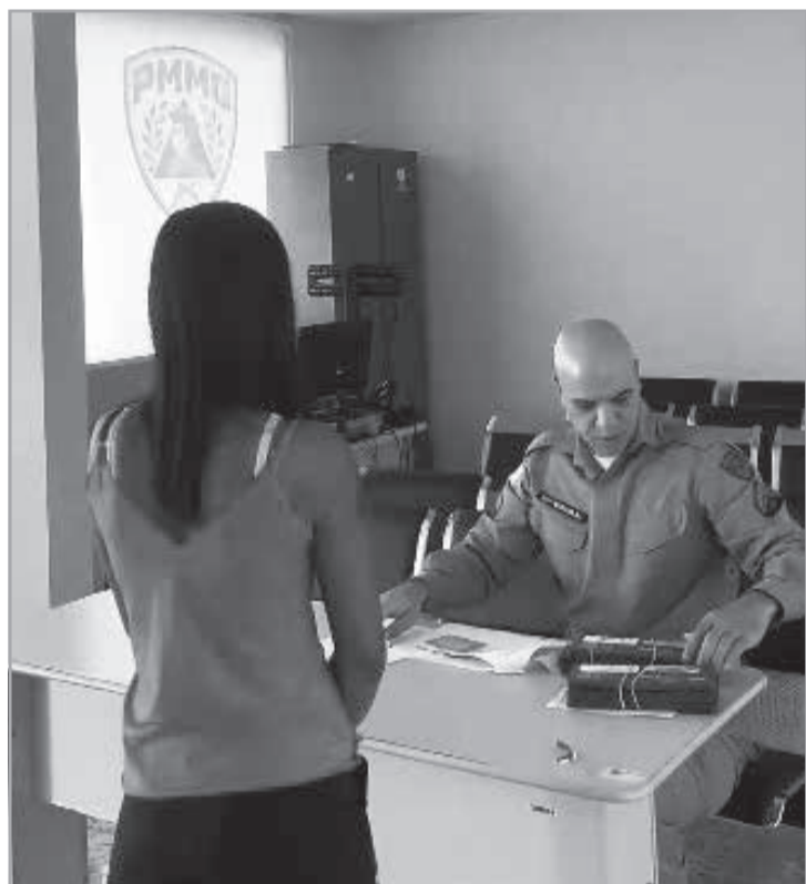
das atividades de segurança pública, fortalecendo os laços com a comunidade e contribuindo para a promoção da cidadania e do bem-estar social. 15ª RPM

A participação da Polícia Militar na entrega dos cartões demonstra, mais uma vez, sua atuação além