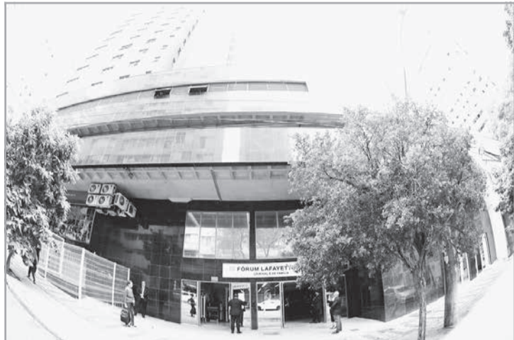
Pena foi fixada em 12 anos e seis meses pelo juiz Marco Antônio Silva

Perseguição - O crime foi cometido em 8/8/2015, no bairro Taquaril, região Leste de Belo Horizonte. O réu ameaçou a ex-companheira com uma faca e a obrigou a entrar no carro, onde voltou a ameaçá-la. Quando passavam em frente a uma unidade da Polícia Militar, a vítima, que trabalha como professora, tentou saltar do veículo