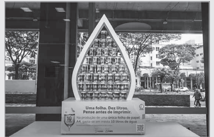
A ação promovida na sede do TJMG será estendida a outras unidades, inclusive no interior do Estado

Ela lembrou que o CNJ publicou a Resolução nº 400/2021, que dispõe sobre a política de sustentabilidade no âmbito do Poder Judiciário: “Reporta que todos os 91 tribu-