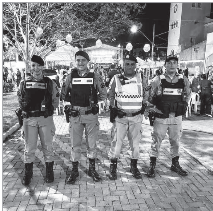
compromisso da instituição com a proteção da comunidade. 15ª RPM - 70º BPM - O AGUERRIDO - Ara-

A atuação da Polícia Militar teve como objetivo preservar a ordem pública e garantir que os participantes desfrutassem do evento de forma segura, reforçando o