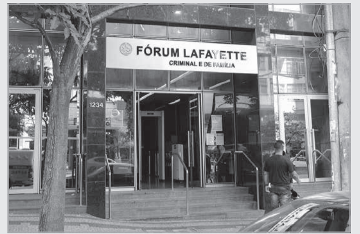
Réu foi condenado pelo 3º Tribunal do Júri de Belo Horizonte

Os jurados consideraram que o réu agiu impelido sob violenta emoção, já que o comprador havia dado um soco nele momentos antes. A vítima foi atingida com um tiro no peito, passou por atendimen-