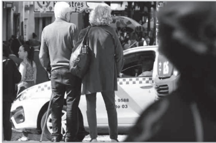
População idosa de Juiz de Fora cresceu 56,1% em 12 anos e já representa 20,2% dos moradores do município, segundo o Censo 2022

ExpoQueijo Brasil 2026 reúne 19 países - Produtores de 19 países estarão reunidos em Araxá, entre os dias 25 e 28 de junho, para disputar o cobiçado troféu Super Ouro da ExpoQueijo Brasil 2026. Considerada a principal premiação de queijo artesanal das Américas, a sexta edição do evento se consolida como uma das mais importantes vitrines internacionais do agronegócio e da gastronomia. O concurso Araxá International Cheese Awards contará com representantes de nações tradicionais na produção queijeira, como França, Itália, Suíça, Holanda, Espanha e Portugal, além de produtores de 18