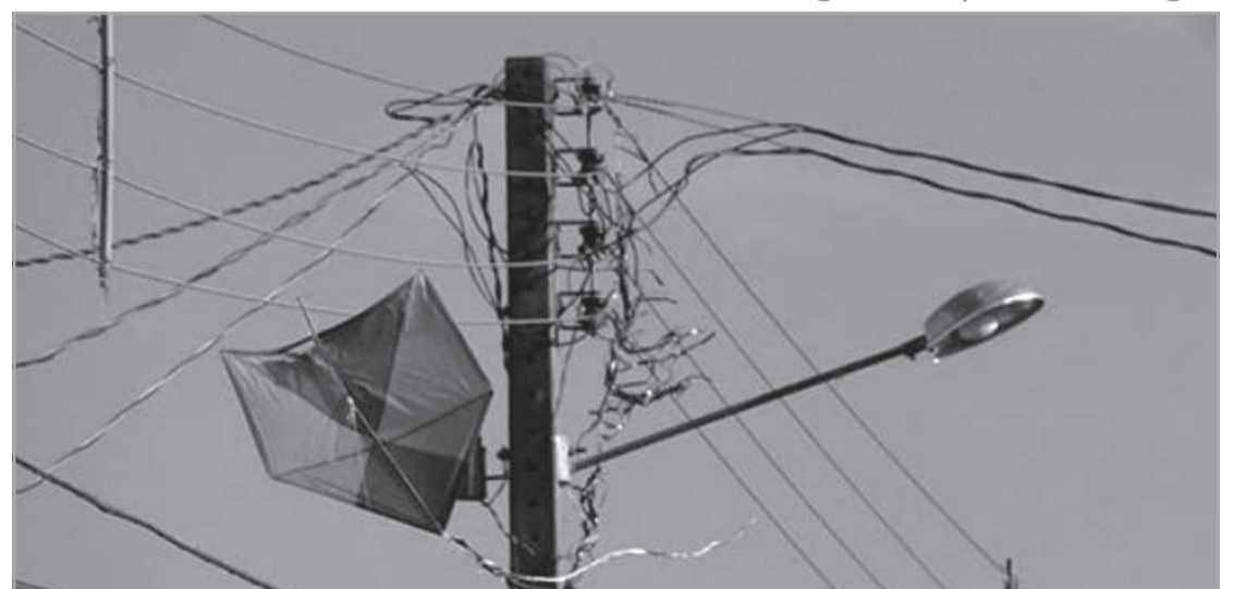
Ocorrências envolvendo pipas na rede elétrica da Cemig afetaram mais de 1 milhão de clientes ao longo de 2025

De acordo com Jorge Magno, além da capaci-