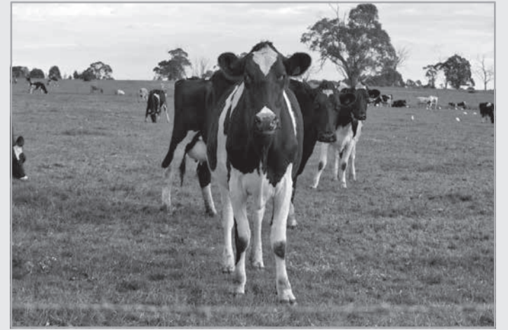
A 21ª Câmara Cível do TJMG manteve decisão da Comarca de Campina Verde que reconheceu os danos morais na falsa acusação de roubo de gado

Segundo o processo, a disputa começou em 2012, quando o réu registrou boletim de ocorrência acusando o vizinho de furto ao dar falta de duas cabeças de gado. No entanto, ao longo da ação criminal, foi provada a “inexistência do fato”, ou seja, a Justiça atestou que não houve furto e absolveu o produtor, que entrou com ação cível pedindo o reconhecimento de danos morais. Ainda assim, o fazendeiro continuou acusando o vizinho na comunidade. Durante a audiência do processo, chegou a afirmar que “continu-